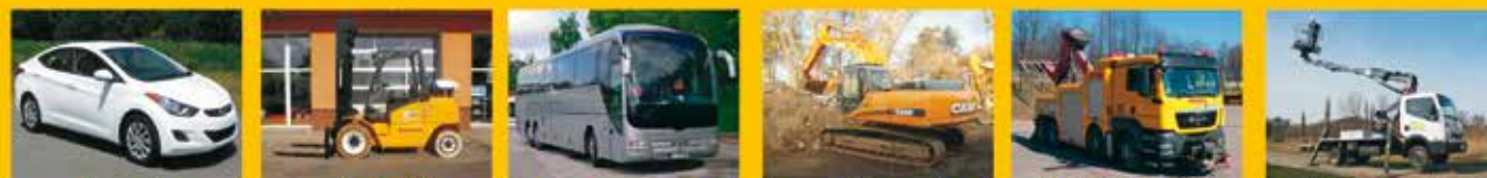
kierowców operatorów wózków kierowców przewożących osoby operatorów sprzętu kierowców ciężarówek pracujących na wysokościach

Zapraszamy do korzystania z naszych usług