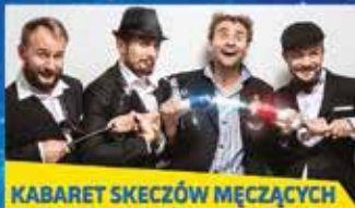
KABARET SKECZÓW MĘCZĄCYCH