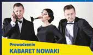
Prowadzenie KABARET NOWAKI