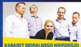
KABARET MORALNEGO NIEPOKOJU