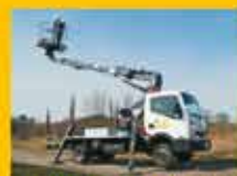
pracujących na wysokościach

Zapraszamy do korzystania z naszych usług