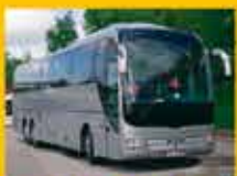
kierowców przewożących osoby