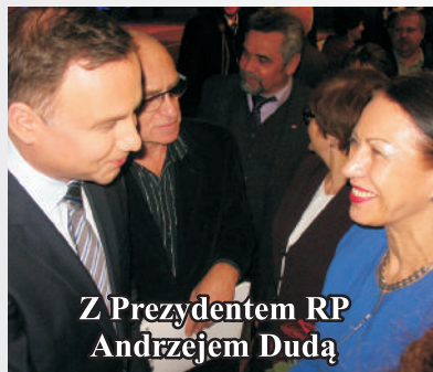
Z Prezydentem RP Andrzejem Dudą