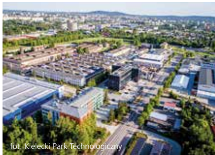
fol. Kielce Park Technologiczny

Kluczowym elementem całej inwestycji, umożliwiającym skomunikowanie tej części miasta z ulicami Zagnańską i Witosa będzie wiadukt poprowadzony nad torami linii kolejowej nr 8. Realizacja tego przedsięwzięcia będzie bardzo skomplikowana, bo budowa prowadzona będzie bez wyłączenia ruchu kolejowego. Poza tym wiadukt będzie największym tego typu