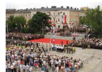
fol. UM Kielce