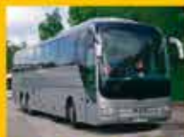
kierowców przewożących osoby