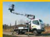
pracujących na wysokościach

Zapraszamy do korzystania z naszych usług