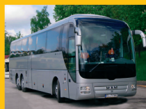
kierowców przewożących osoby