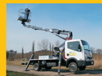
pracujących na wysokościach

Zapraszamy do korzystania z naszych usług